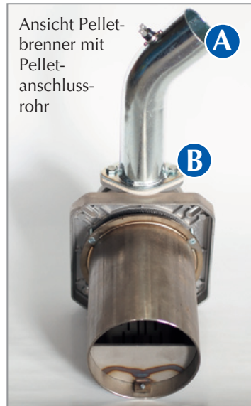
Ansicht Pelletbrenner mit Pelletanschlussrohr

Reinigung des Pelletbrennerrosts mittels einer Drahtbürste (E).