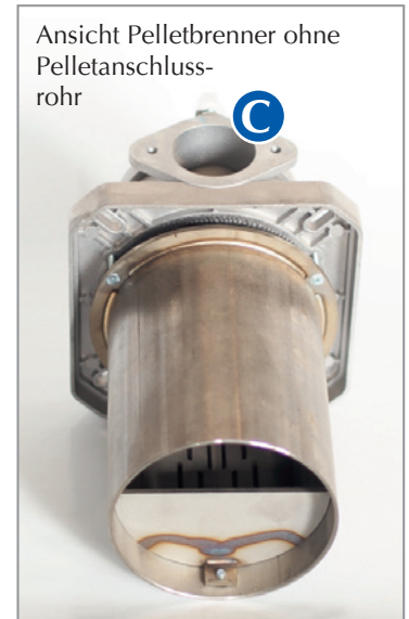
Ansicht Pelletbrenner ohne Pelletanschlussrohr